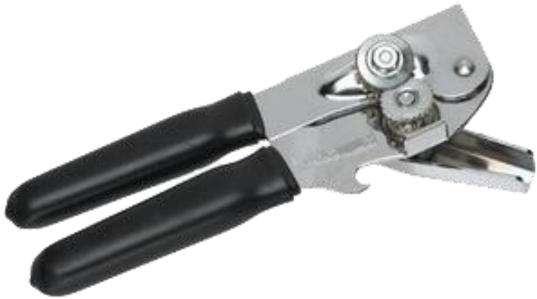
đồ mở hộp