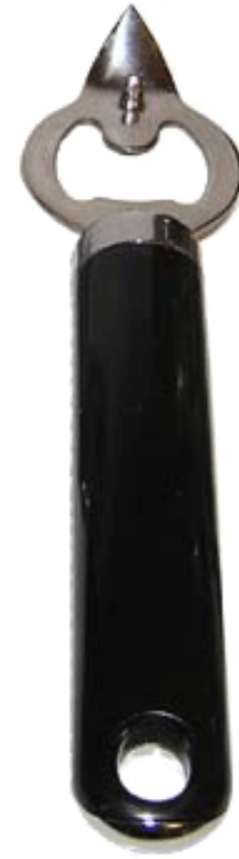
đồ mở chai