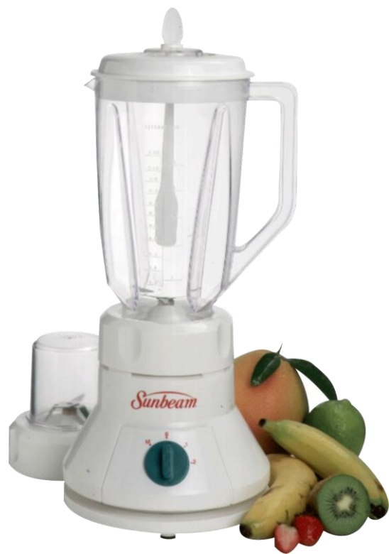
máy xay sinh tố