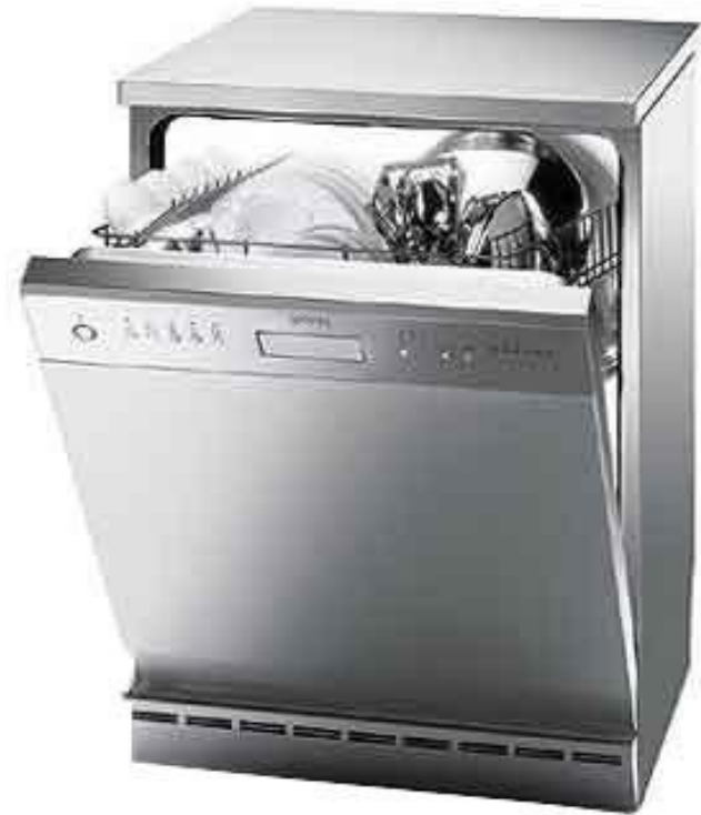
máy rửa chén