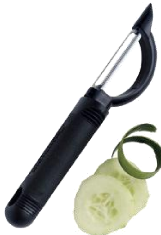
đồ gọt vỏ