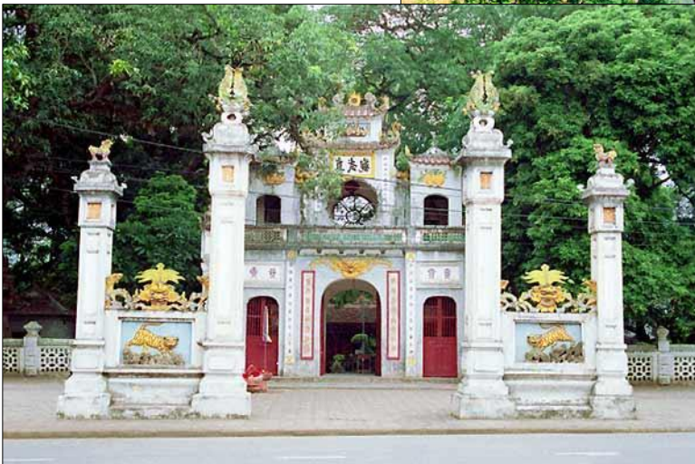
▲ Đền Quán Thánh, một trong bốn đền thờ để trần