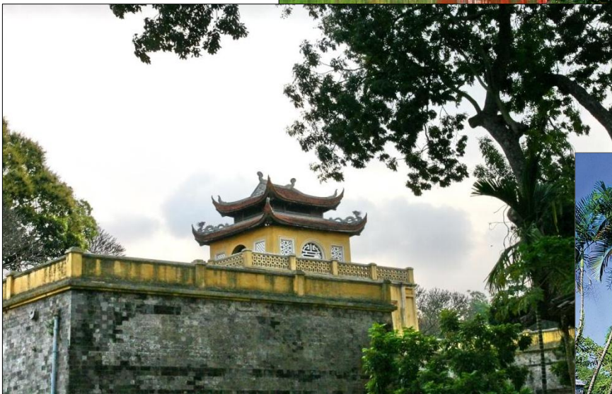
▲ Hậu Lâu (Thành Cổ Hà Nội)