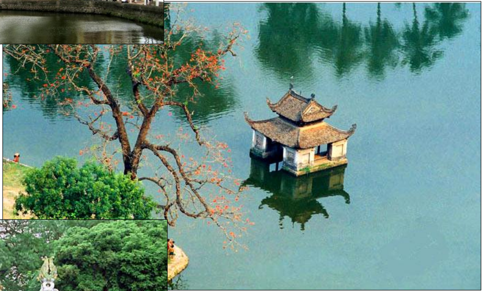
Chùa Thầy ▼