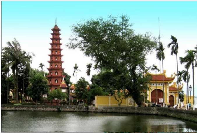
◀ Chùa Trấn Quốc