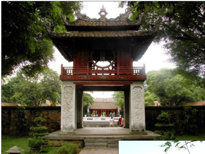
◀ Văn Miếu Quốc Tử Giám