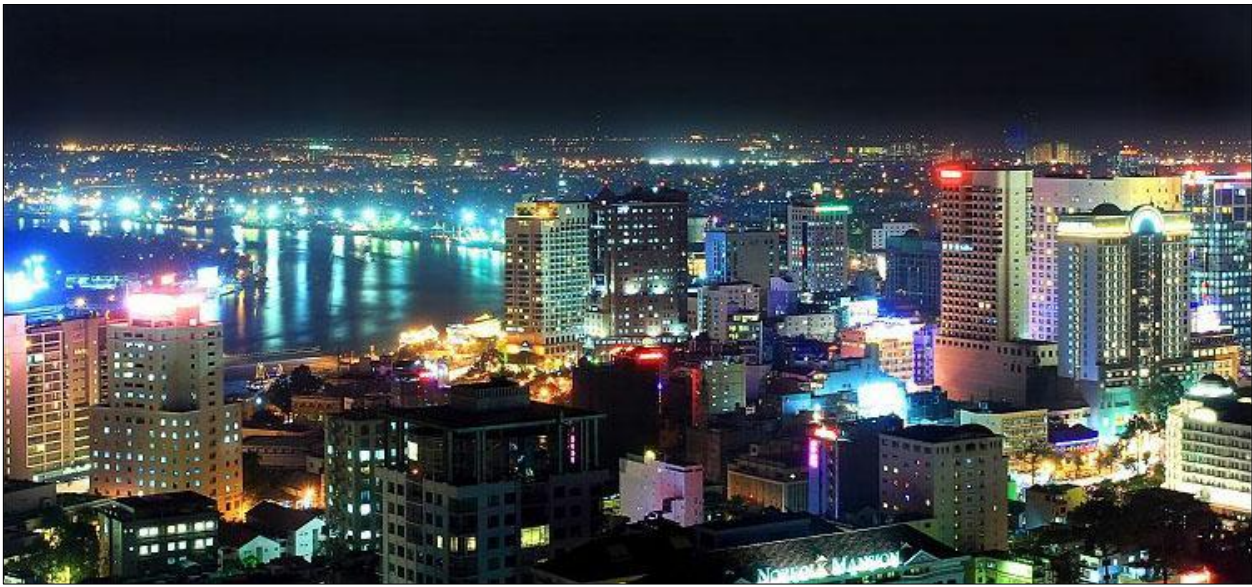
▲ Sài Gòn vào đêm