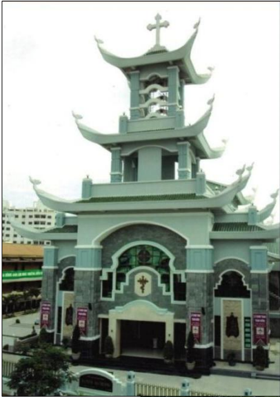
Nhà Thờ Ba Chông ▲