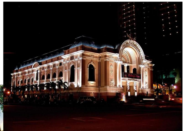
▼ Nhà Hát Lớn