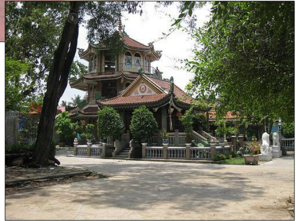
Chùa Nam Thiên Nhất Trụ (Chùa Một Cột ở miền Nam) ▲