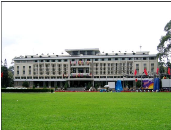
▲ Dinh Độc Lập