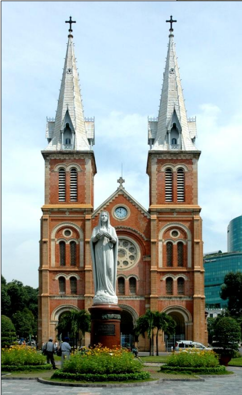
◀ Nhà Thờ Đức Bà