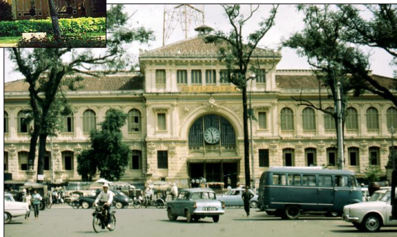
◀ Viện Bảo Tàng