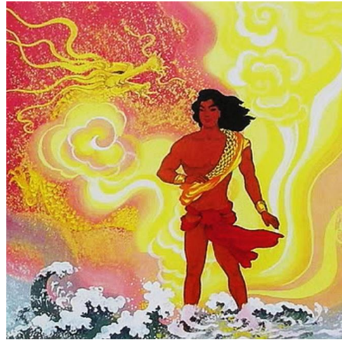
Lạc Long Quân

Cứ theo tục truyền thì vua Đế Minh là cháu ba đời của vua Thần Nông, đi tuần thú phương Nam đến núi Ngũ Lĩnh (thuộc tỉnh Hồ Nam bây giờ) gặp một nàng tiên, lấy nhau, sinh ra người con tên là Lộc Tục. Sau Đế Minh truyền ngôi lại cho con trưởng là Đế Nghi làm vua phương Bắc, và phong cho Lộc Tục làm vua phương Nam, xưng là Kinh Dương Vương, quốc hiệu là Xích Quỷ. Bờ cõi nước Xích Quỷ bấy giờ phía bắc giáp Động Đình Hồ (Hồ Nam), phía nam giáp nước Hồ Tôn (Chiêm Thành), phía tây giáp Ba Thục (Tứ Xuyên), phía đông giáp bể Nam Hải.