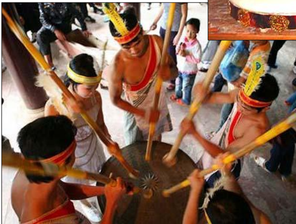
◀ Đánh trống đồng