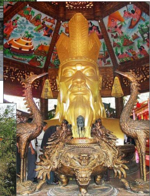
Tượng Vua Hùng (Suối Tiên). ▲