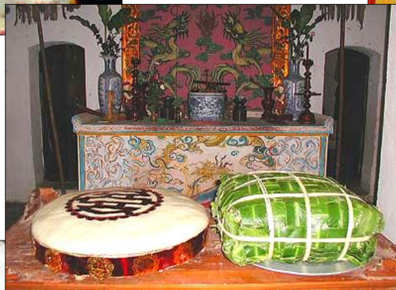
▲ Lễ phẩm: bánh dày, bánh chưng