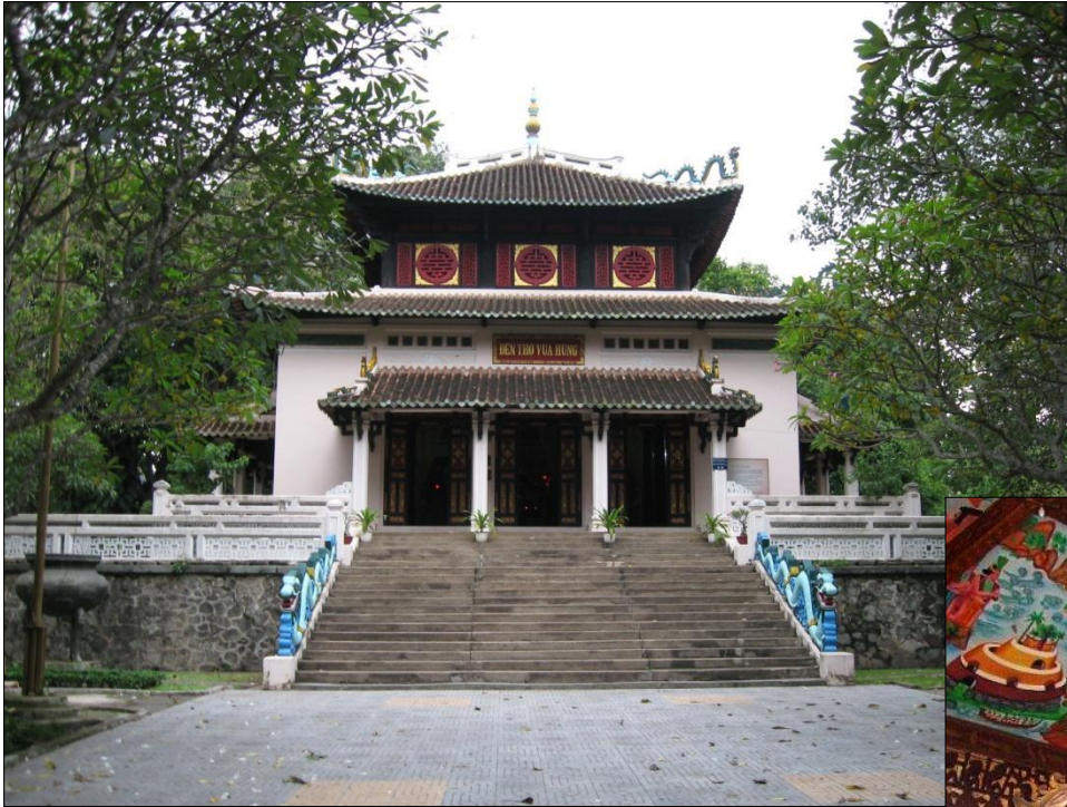
▲ Đền Hùng Vương (Sài Gòn)