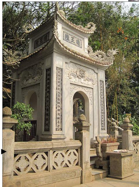
→ Lăng Vua Hùng (Việt Trì, Phú Thọ): Tương truyền là mộ của Vua Hùng Vương thứ 6. Sau khi Thánh Gióng đánh giặc Ân, bay lên trời, Vua Hùng đã hóa ở đây.