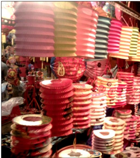
▼ Đèn xếp