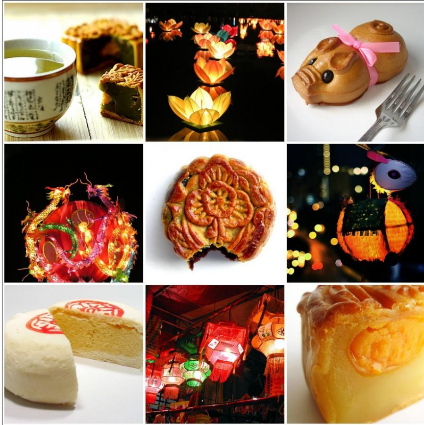
◀ Các loại đèn và bánh trung thu