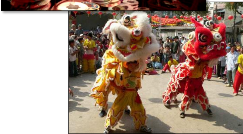
▲ Múa lân