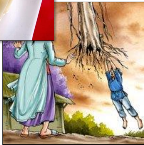
Chú Cuội ▲