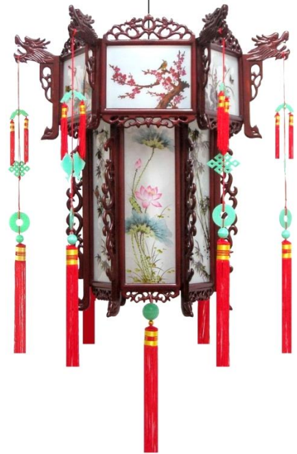
▲ Đèn kéo quân