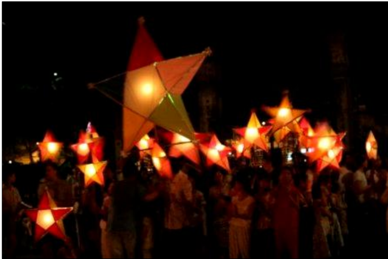
▲ Tết Trung Thu rước đèn đi chơi...