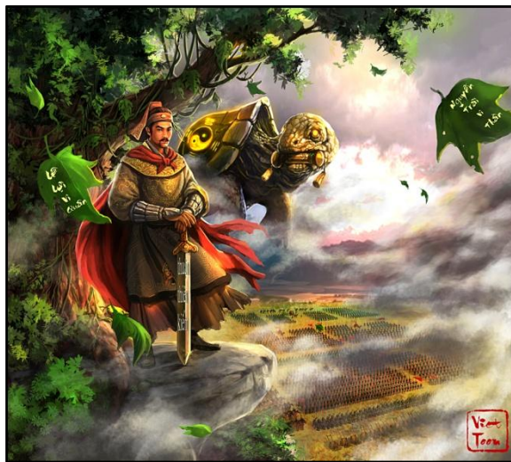
Lê Lợi được thần Kim Quy dâng Thuận Thiên Kiếm.

Sau khi dẹp tan giặc Minh, Lê Lợi sai Nguyễn Trãi soạn bài Bình Ngô Đại Cáo báo cáo cho dân chúng biết sự thắng trận rồi lên ngôi lấy hiệu là Lê Thái Tổ, dựng cơ nghiệp cho nhà Hậu Lê.